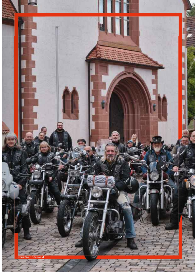
Jesus Biker, Odenwald